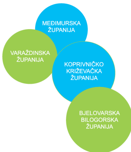
Slika 1. Područje provedbe Programa JAKO

Nacionalna zaklada za razvoj civilnog društva pokrenula je krajem 2006. godine provođenje Programa regionalnog razvoja i jačanja sposobnosti organizacija civilnog društva na lokalnoj i regionalnoj razini s ciljem da podrži stvaranje učinkovitijeg nevladinog, neprofitnog sektora te aktivnog građanstva u Republici Hrvatskoj. Programom se želi omogućiti organizacijama civilnoga društva pristup i korištenje visokokvalitetnih usluga potpore koje će zadovoljiti njihove potrebe kada ih budu trebale.